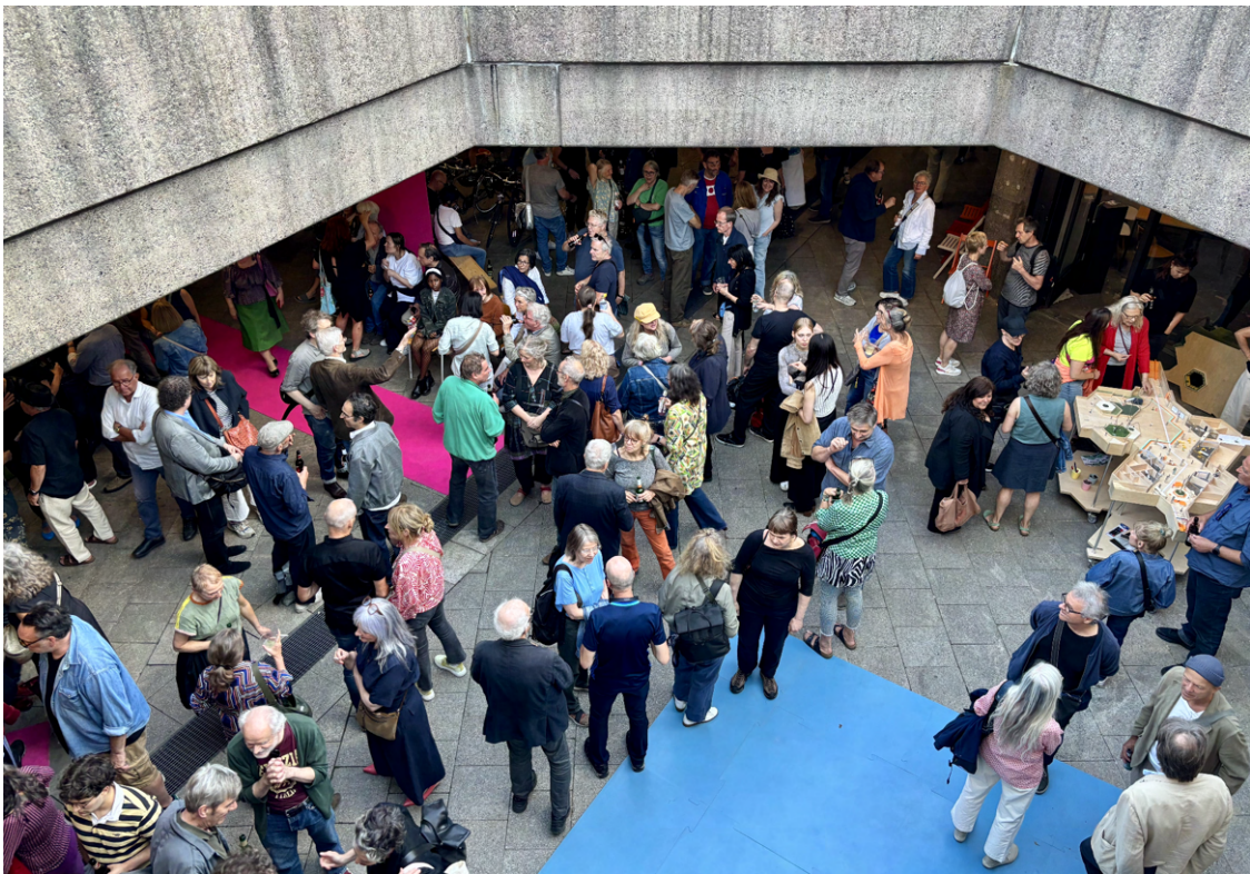
Volles Haus bei der Eröffnung der Gruppenausstellung "Great Summer of Art" im LABOR Ebertplatz. Es sind über 100 Arbeiten zu sehen.