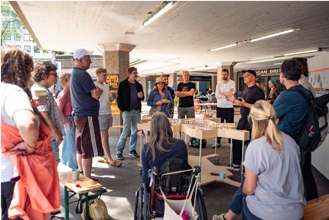
Workshop am 12.7.25 zu Gestaltungsmaßnahmen in der Passage mit raumwerk.architekten.