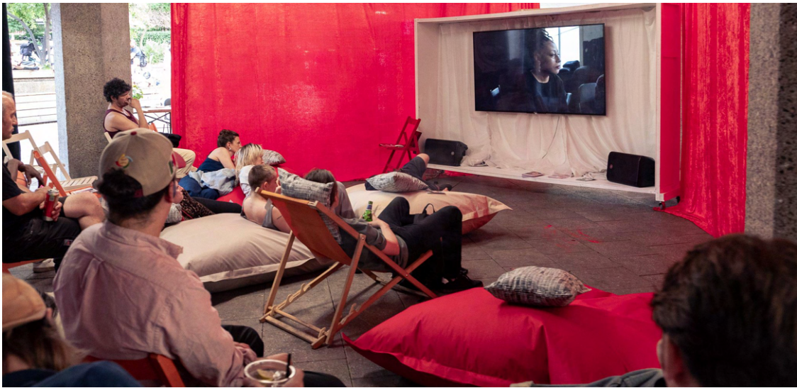
Pop-Up Kino in der Ebertplatz-Passage: Im August wird es jeden Donnerstag Filmvorführungen geben.