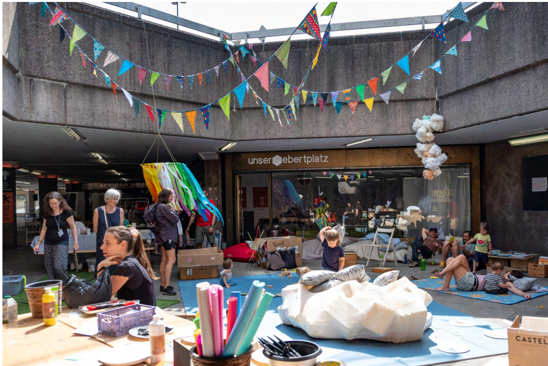
Kinderprogramm im Lichthof der Passage. Nach dem super Feedback wird es bald mehr Kinderprogramm dieser Art am Platz geben.

Lichthof, inklusive Puppentheater und verschiedenen Spiel-Stationen.