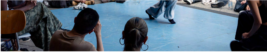
Dance-Battle Finale am 13.7. – der neue mobile Tanzboden wird bald öfter zum Einsatz kommen .