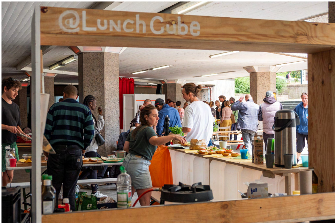
BrunchCube am Samstag, den 12.7. – Brötchen und Kaffee vom krimskramsclub e.V. / .

Los ging es am Freitag mit dem LunchCube, zwei Pop-Up-Bars und offenen Beteiligungsformaten. Am Nachmittag wurde der neue mobile Tanzboden eingeweiht und das frisch gestaltete Leitsystem für die Passage vorgestellt – zwei Maßnahmen, die unmittelbar erlebbar machen, wie sich der Ort weiterentwickelt. Nach Redebeiträgen und Statements von Engagierten und Politik stand der weitere Abend im Zeichen des 20-jährigen Jubiläums des Kunstraums LABOR Ebertplatz. Gefeierte wurde mit der Eröffnung einer Gruppenausstellung von über 100 Künstler*innen, die alle schon einmal im Kunstraum über die Jahre zu sehen waren.