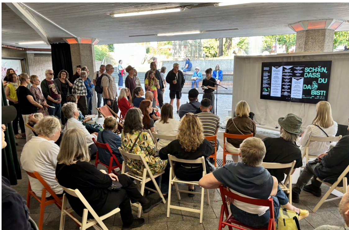
Unterschiedliche Redebeiträge im Rahmen des Aktionswochenendes.

* Sonderöffnungszeiten zur DC Open am 5., 6. und 7. September 2025