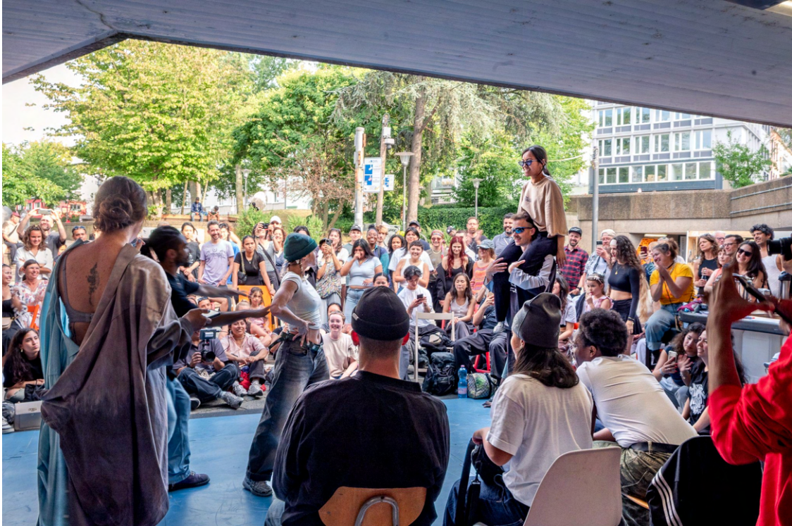
Dance-Battle im Rahmen des Aktionswochenendes SORRY WE*RE OPEN am 13.7.25