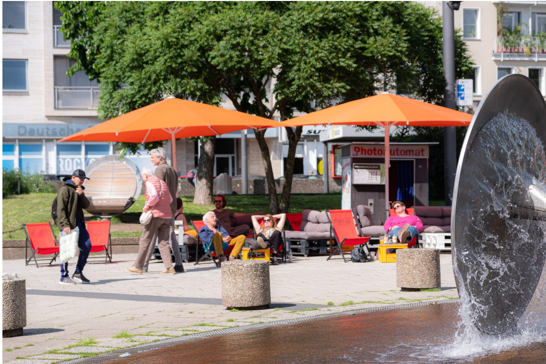
Sommer-Vibes auf dem Ebertplatz.