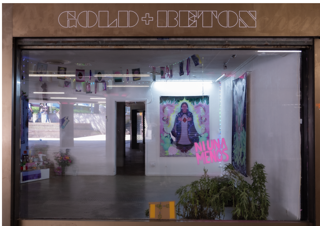
Aktuelle Ausstellung im GOLD und BETON: Me cuidan mis amigxs.