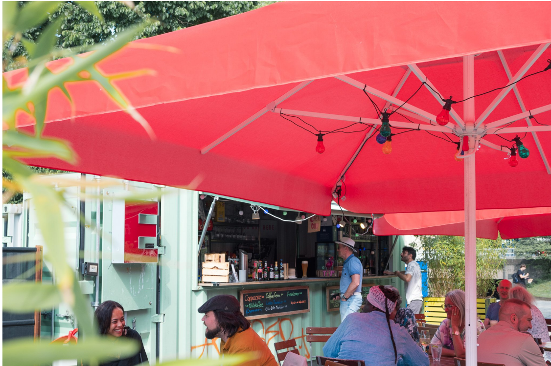
Unser Gastro-Container auf dem Platz ist wieder geöffnet!