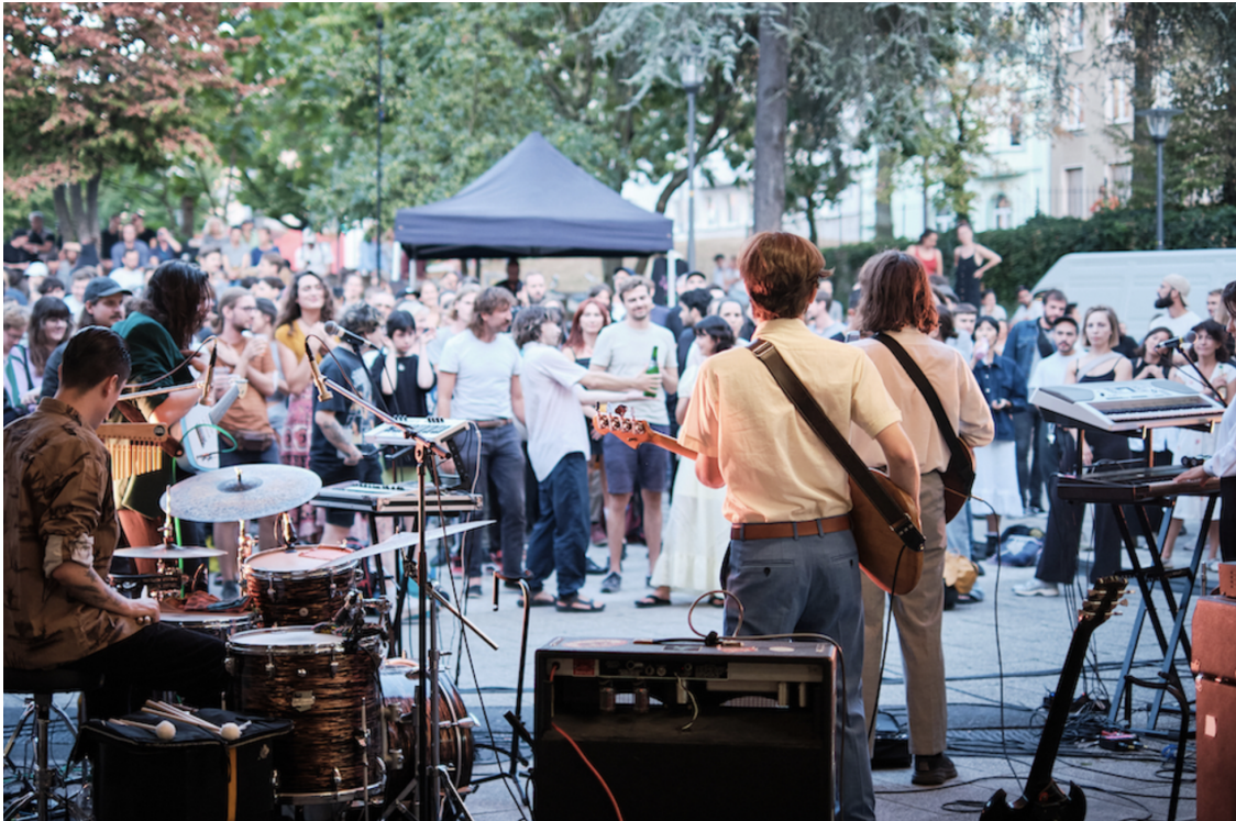
Ebertplatzkonzert im Sommer 2023.