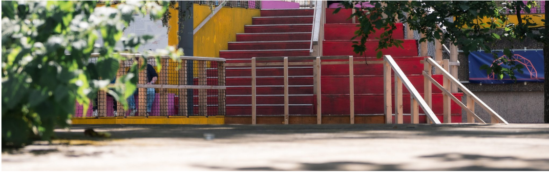
Die Freitreppe ist jetzt farbig!