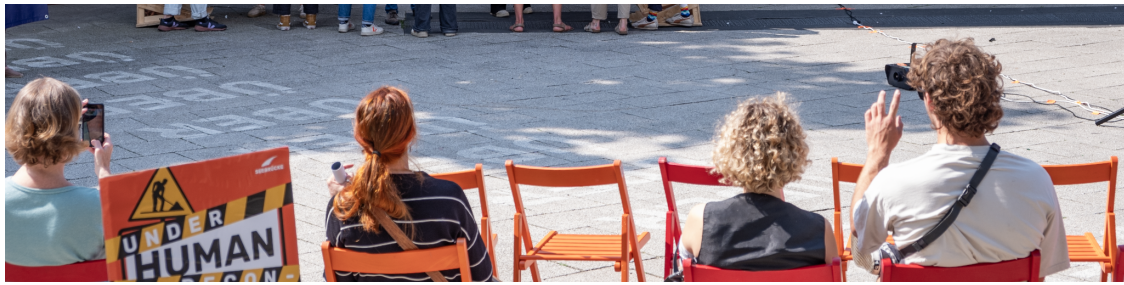
Bei der Eröffnungsveranstaltung von "Eine Brücke für Europa" wird eine symbolische Brücke aufgebaut.