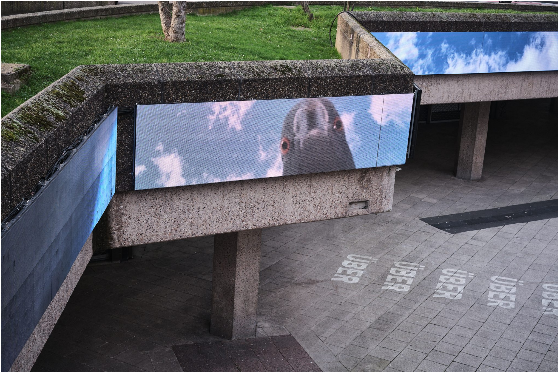
Videokunstarbeit "Tauben treffen sich und fressen Bildschirme" von Marie Lempelius im Fries TV, März 2024, Foto: Helle Habenicht

Fries TV erfahrbar. Start ist heute um 20 Uhr.