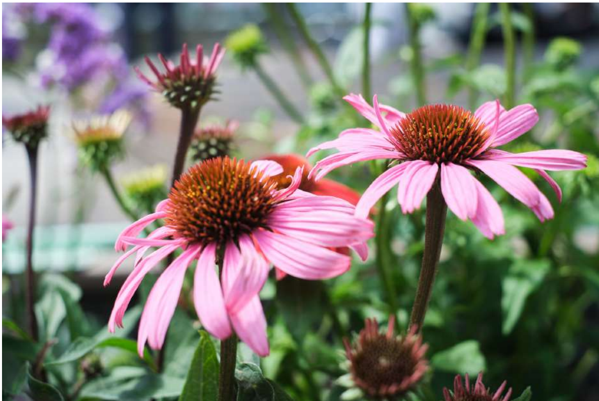
Strahlende Blüten im Sinnespfad der AG Begrünung