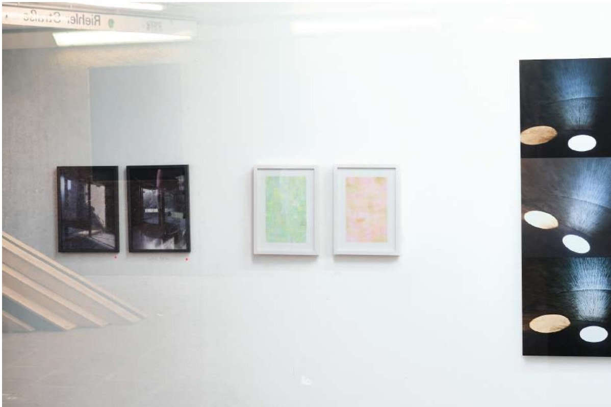
Ausstellung "Feriengäste" im Kunstraum Labor vom 24.06. bis 24.08. - Foto: Stadt Köln

Ebenfalls im Juni reisten wie gewohnt die Feriengäste im Labor zu der wiederkehrenden Sommerausstellung an, um ihre Werke (bis Mitte August) zu präsentieren.