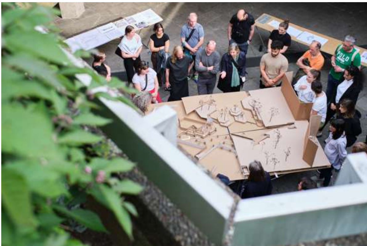
Studierende präsentieren anhand eines Modells ihre Gestaltungsideen im Rahmen des Projekts " Ebertplatz 0? "