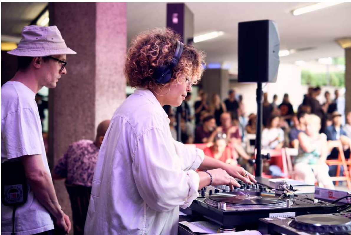
Ebertplatzkonzert #3: dublab Sound Journey "Dilla Time" mit C:Mone & Twit One

Prozessraum, Aktivitäten, Festivals, Partizipation