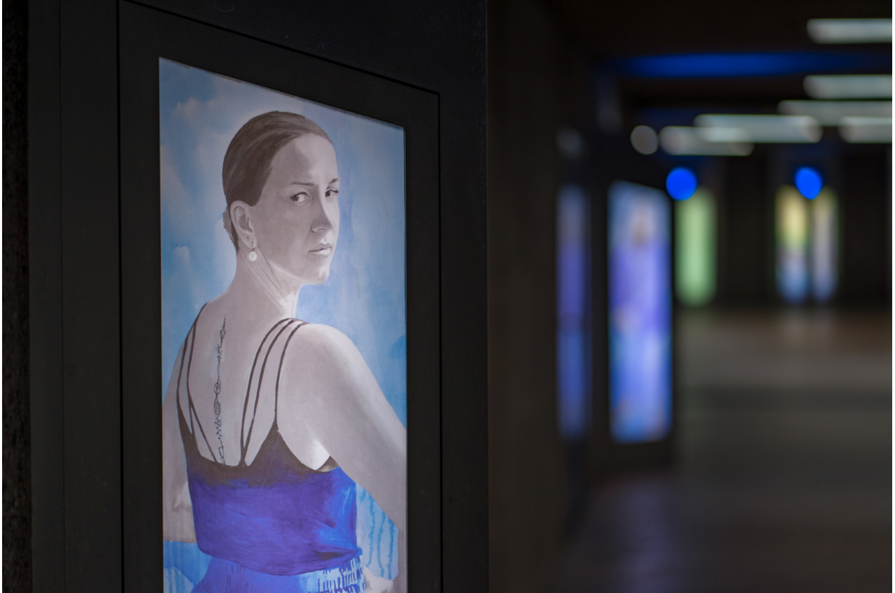
Ausstellung "Legenden Kölner Frauen" von Zrinka Budimlija im nördlichen Zugang zur U-Bahn

Prozessraum, Aktivitäten, Festivals, Partizipation