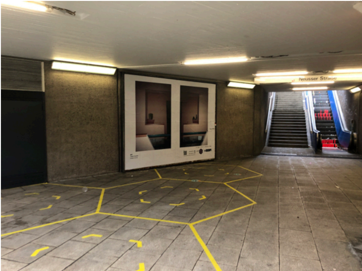
Auf den Ströer Plakatwänden werden ausgewählte Werke des OPEN CALLS gezeigt - Foto: Stadt Köln

Kunsträume neuerdings mehr Kunst entdecken, da dort regelmäßig Werke des weiterhin laufenden OPEN CALL zur künstlerischen Bespielung der Ströer Plakatwände gezeigt werden. Im Mouches Volantes gibt es bis zum 9. Januar noch die Ausstellung "SchwesterInnen touchdown" von Noemi Weber und Milena Weber durch die Schaufenster zu sehen; die Gemeinde zeigt noch bis Ende Januar „I decided to wrap up my family“ von Nigin Beck.