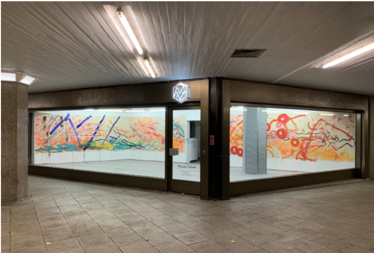
Dritte Ausstellung im Mouches Volantes: "SchwesterInnen touchdown" von Noemi Weber und Milena Weber, Foto - Stadt Köln