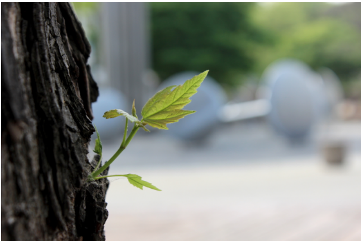
Der Silberahorn ist Teil der “Lebendigen Gesellschaft” am Ebertplatz

Die Düsseldorfer Künstlerin Pia Litzenberger wird am heutigen Freitag erneut drei Schachtische installieren, sodass Ihr bereits am langen Pfingstwochenende auf eine Partie am Platz vorbeikommen könnt. Außerdem findet diesen Sonntag die zweite Baumführung zur “Lebendigen Gesellschaft” des Ebertplatzes statt. Zwecks Infektionsschutz ist die Teilnehmerzahl leider stark begrenzt und die Führung bereits ausgebucht. Ihr könnt die Führung jedoch auch eigenständig mit den Infoplaketten vor Ort durchführen oder online ausprobieren .