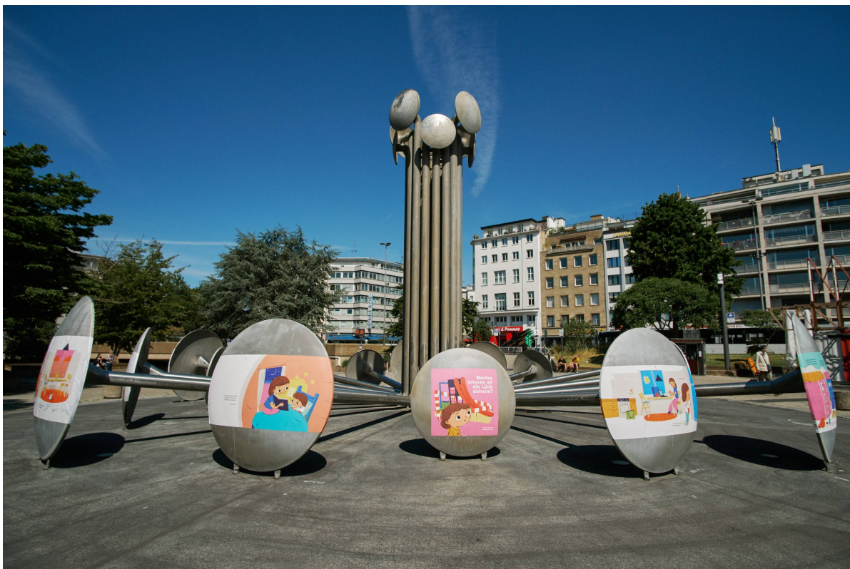
Begehbares Kinderbuch zur Pandemie

Prozessraum, Aktivitäten, Festivals, Partizipation