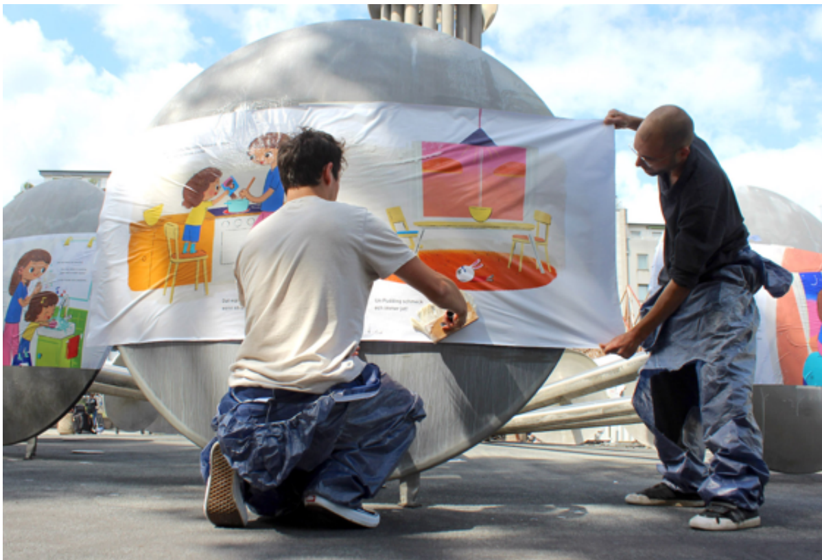
Anbringung des temporären Kinderbuchs