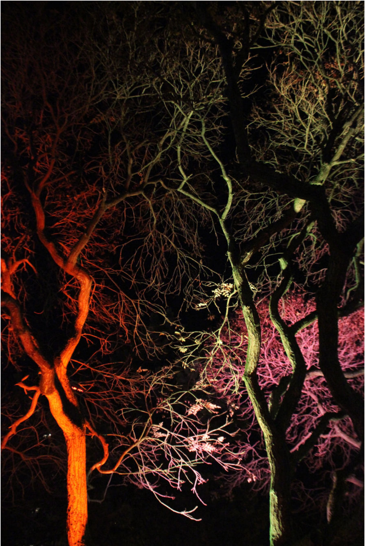
Lichtinstallation - Foto: Helle Habenicht

Der Herbst war ruhiger, doch unser AUSBLICK wird gleich zeigen, dass wir