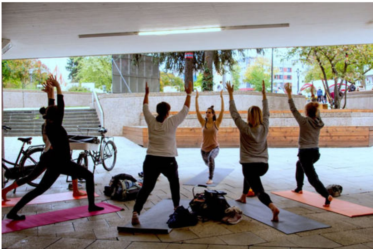
Ebertplatz erleben: Zeitreise

Übrigens freuen wir uns immer, wenn wir tatkräftige Unterstützung bei der „Ebertplatz erleben“-Reihe bekommen. Hier kannst Du Dich komplett ausleben und Deine eigenen Aktionen vorschlagen oder einfach beim Kaffee ausschenken helfen – gern gesehen bist Du allemal und immer!