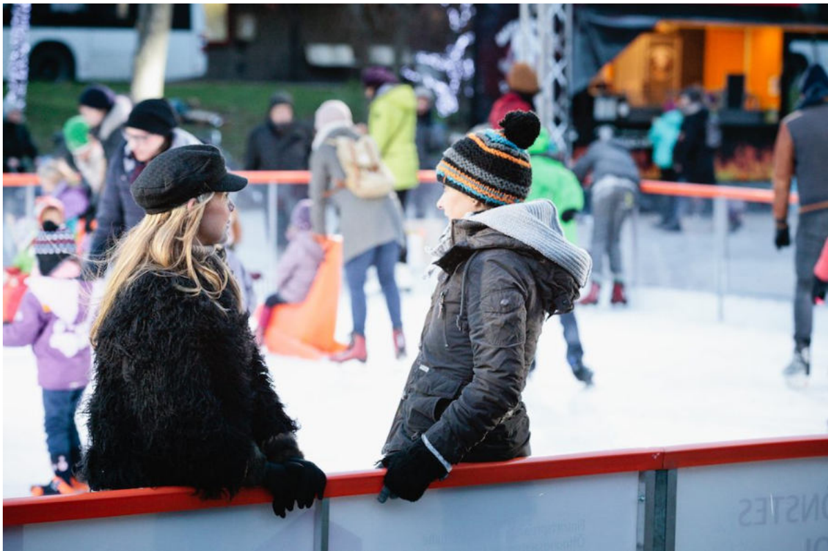
Unsere Eisbahn 2018 - Foto: Astrid Piethan

Zwei Wochen später haben wir dann die nächste Eröffnung im Gold+Beton: Dort kannst Du Dir ab Donnerstag, den 19. Dezember die Werke der Klasse von Tamina Amadyar angucken, die von der Hochschule in Karlsruhe kommt. Alle Eröffnungen gehen wie gewohnt um 19 Uhr los.