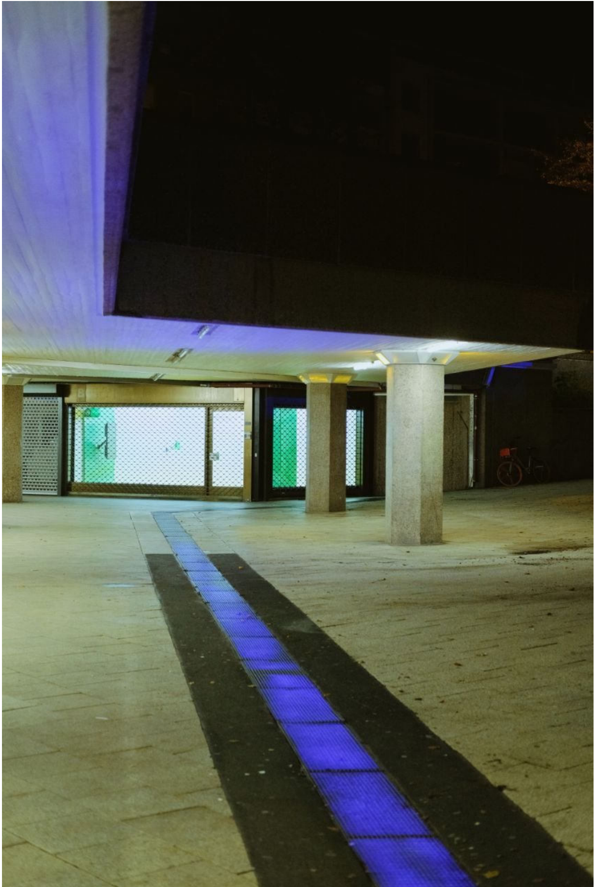
"Aus der Tiefe ein Licht" als Teil von "Kellerlichter" - Foto: Roman Jungblut

Da es zum Zwischennutzungskonzept dazu gehört, immer wieder etwas