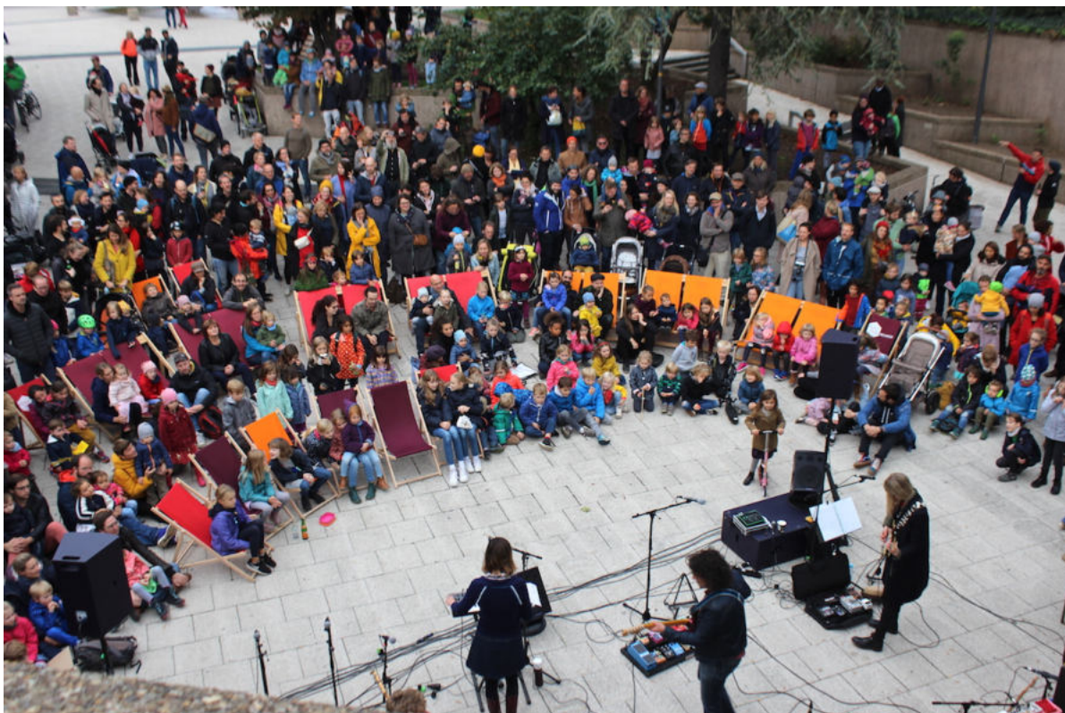
EbertPÄNZ mit Gorilla Club

Die Alte Feuerwache e.V. ist mit ihrer Aktionsreihe " Ebertplatz erleben " auf Zeitreise gegangen. Die mitreisenden Besucher konnten den Platz in der Vergangenheit, der Zukunft und der Gegenwart erkunden. Dabei gab es zum Beispiel Führungen genauso wie Bilderrätsel, es wurde getanzt, gespielt und Yoga gemacht.