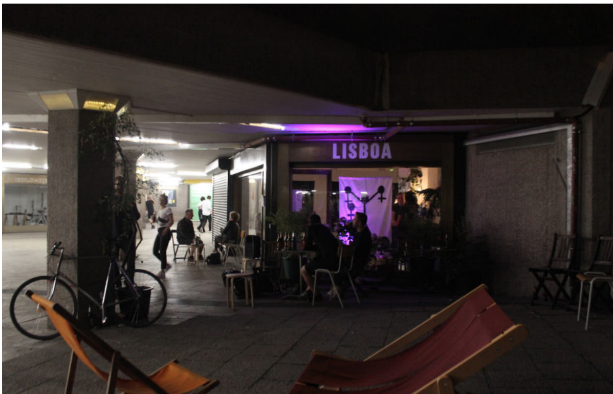
Euphories "Lisboa"

Wir haben bei Instagram schon einen Hinweis auf eine kleine Neuerung am Platz gegeben: Bald haben wir einen „ Sinnespfad “ in unserem Beet und wir freuen uns auf die Umsetzung am Dienstag, den 29. Juli von 10 Uhr bis 15 Uhr . Der Pfad ist für Kitas und Schulklassen und besteht aus mehreren Pflanzkisten, die es zu erkunden gilt. Die Infos, wer uns dabei geholfen hat und wie das Ganze genau aussehen wird, findest Du auf unserer Website .