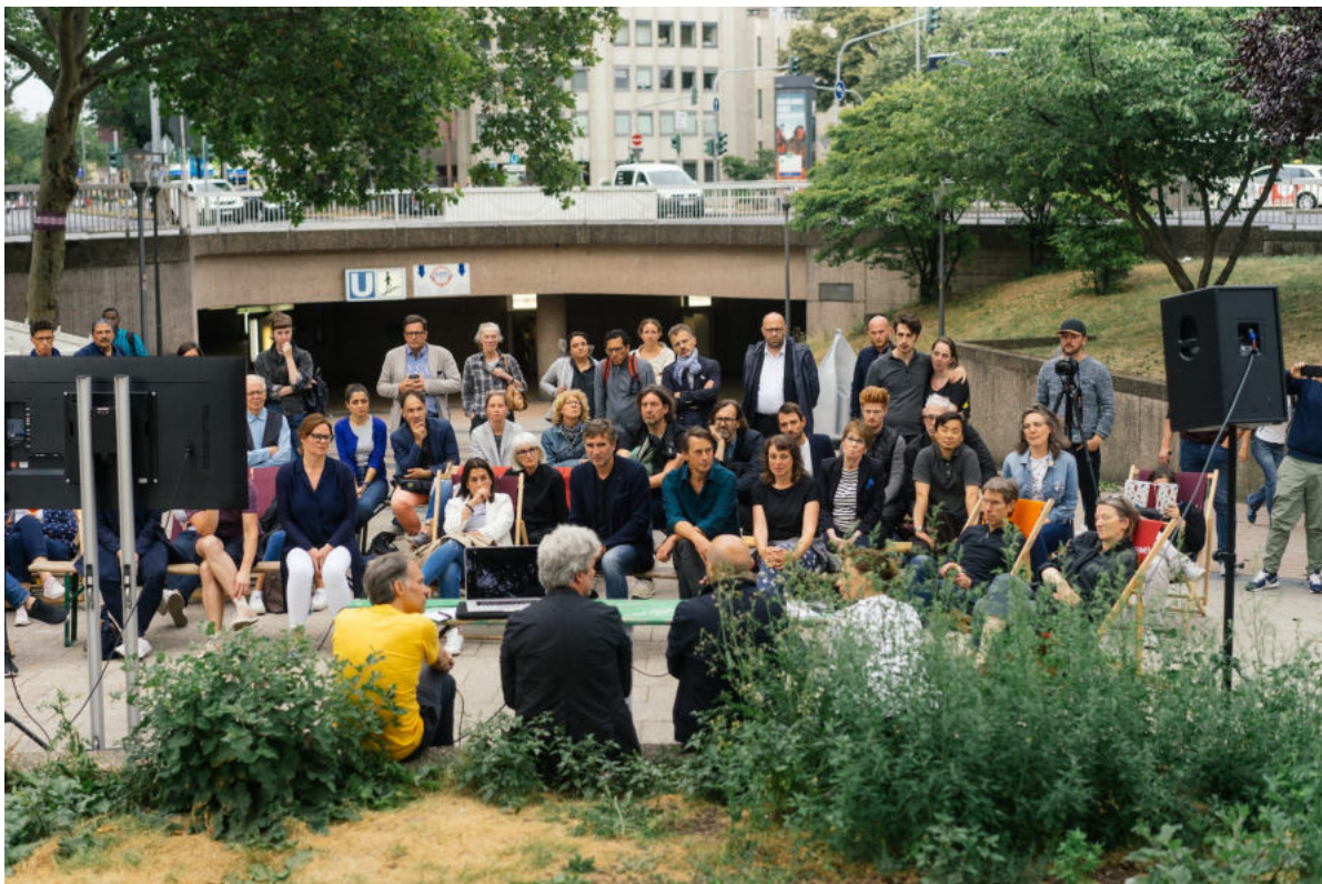
Planet Ebertplatz IV

Sommer, Sonne, Ferien! Damit diese für die Kids (zwischen 6 und 12 Jahren) nicht zu langweilig werden, hat die sich Alte Feuerwache e.V. überlegt, jeden Montagvormittag vom 15. Juli bis zum 26. August die Stadt zu erforschen. Die Expedition dauert zwischen 60 und 90 Minuten und es wird ab 10 Uhr in die unbekanntenen Gebiete aufgebrochen. Lies hier alle Termine und Infos nach.