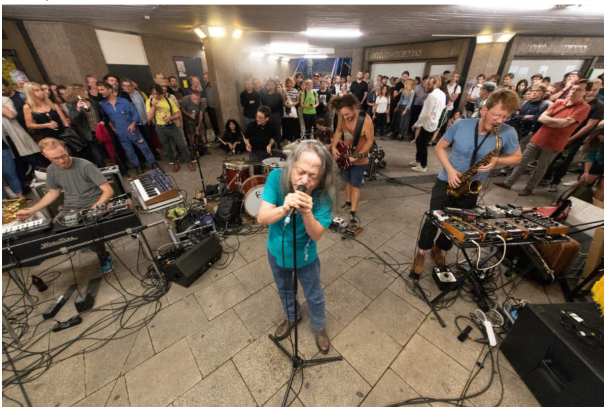
Sommerfest der freien Kunsträume (C.A.R. + Damo Suzuki)

Die Veranstaltungsreihe „ Ebertplatz Erleben “ der Alten Feuerwache e.V. hat im letzten Monat zu Tisch gebeten mit einer langen Tafel und vielen Aktionen. Dank der freien Kunsträume in der Ebertplatzpassage haben wir ein fantastisches Sommerfest mit unglaublich vielen Gästen feiern können - wir schwelgen immer noch in den schönen Erinnerungen. Auch fanden zwei weitere Abende im Rahmen der Diskursreihe „Planet Ebertplatz“ statt. Die nächste steht heute mit dem Thema „ Dritte Orte “ an!