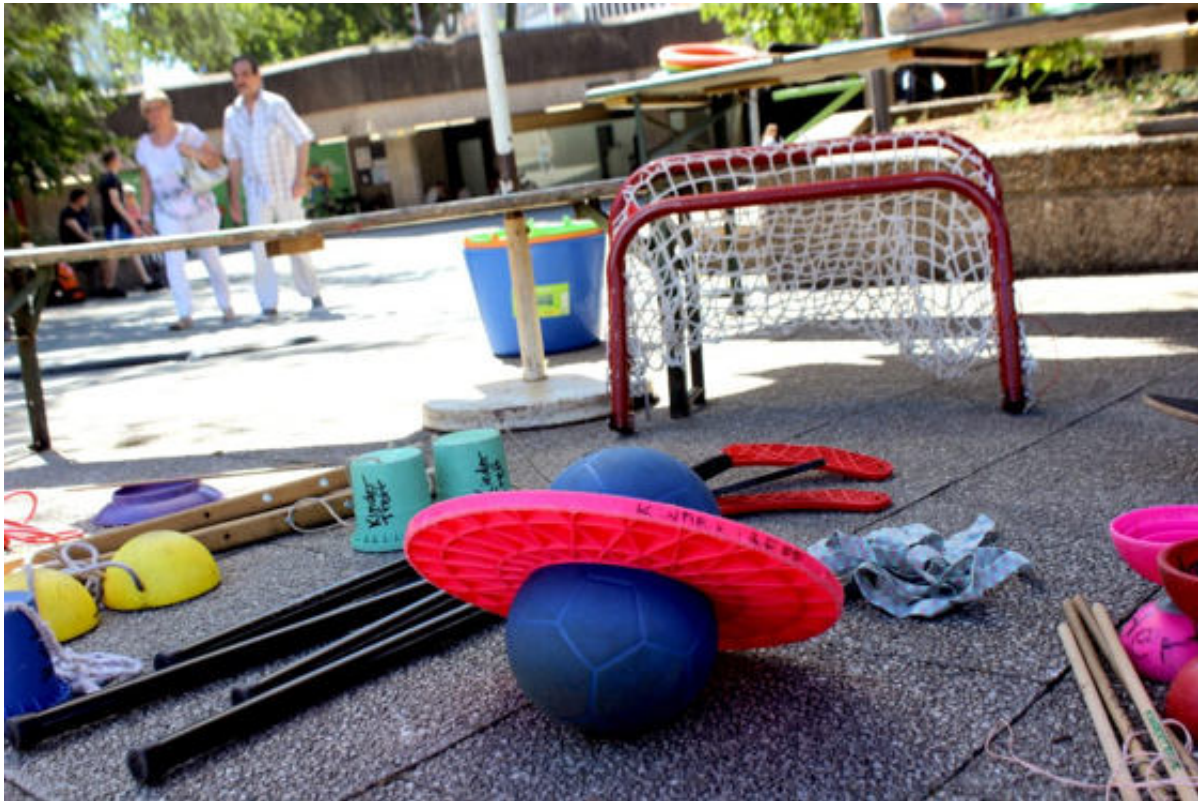
Ebertplatz Erleben

ordentlichen Kinder-Rambazamba veranstaltet. Aber auch „ Live auf der Kulturbühne “, Dublab's „ Sound Journey “ und die „ Offene Musikbühne “ werden mit viel Enthusiasmus angenommen.