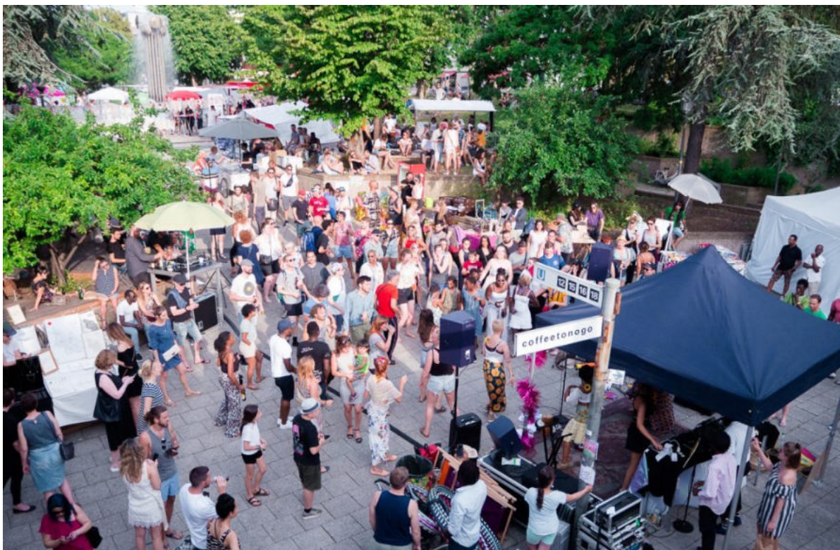
Helios & Selene - der Markt für Gutes Leben

Prozessraum, Aktivitäten, Festivals, Partizipation