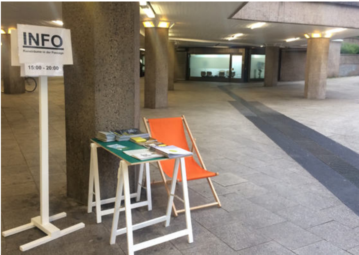
Neuer Infostand der Kunsträume in der Ebertplatzpassage

Was die Bienen können, hat auch unser Container in petto: Vermehrung . Seit ein paar Tagen steht das Heim der Gastronomie nicht mehr alleine auf weiter Flur, zwei kleinere Lagercontainer sind noch dazu gekommen, denn nicht nur das Platz-Café braucht mehr Stauraum, auch die Gerätschaften der AG Begrünung sowie die Sonnenstühle finden jetzt ein zu Hause direkt auf dem Platz. Außerdem bekommt das Sportamt der Stadt Köln ein bisschen Raum. Denn dank der Kooperation werden wir bald noch einen Sportkiosk bekommen, wo Du Dir allerlei Utensilien für mehr Bewegung am Ebertplatz ausleihen kannst.