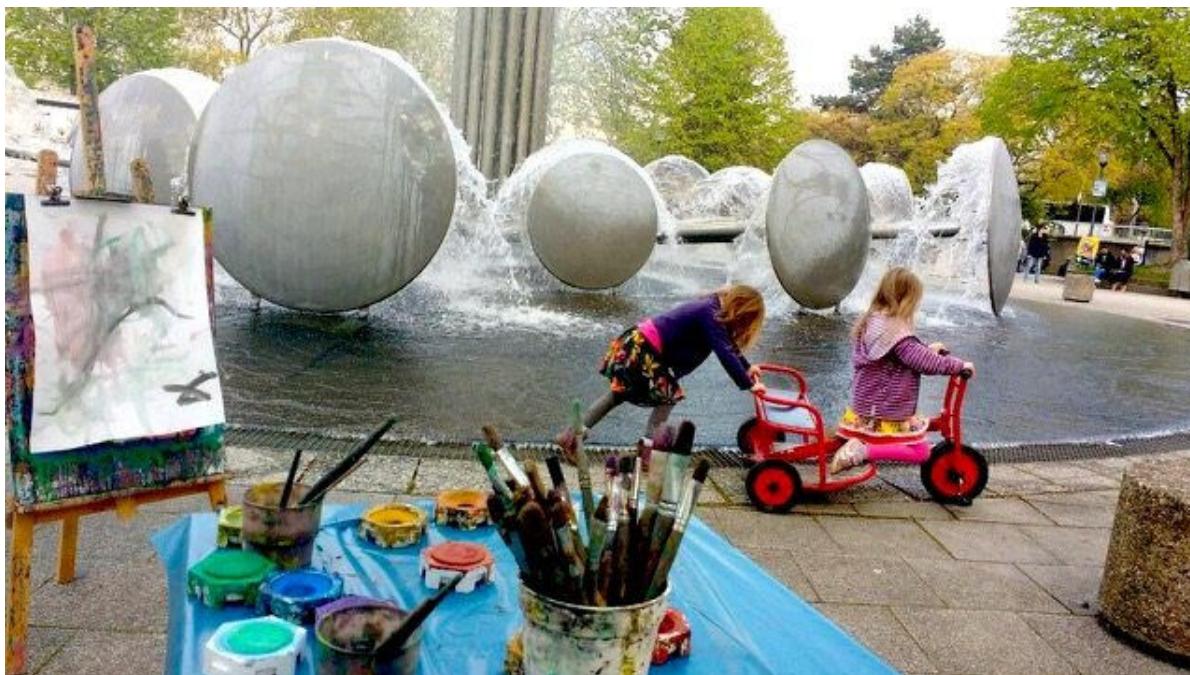
Besucherinnen des Spielmobils "Juppi"

Prozessraum, Aktivitäten, Festivals, Partizipation